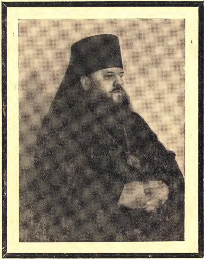
НЕСТОР, ЕПИСКОП КУРСКИЙ И БЕЛГОРОДСКИЙ